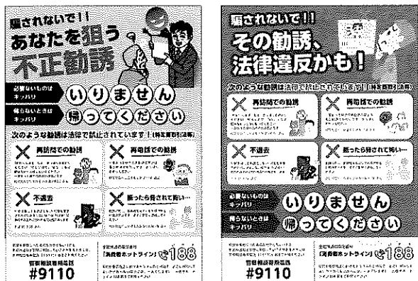
特商法ガイド付き不正勧誘抑止チラシ A(左)、B

〔チラシの種類〕▷特商法ガイド付き不正勧誘抑止A▷同・B(以上特商法違反チェックシート付き)▷不正勧誘抑止A▷同・B(以上悪質勧誘事例等)▷再勧誘禁止案内A▷同・B▷同・C▷同・D(以上ガス会社変更後の困り事を救済する等)▷給湯器点検詐欺抑止A▷同・B(訪問時による事件事例等)