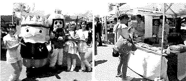
キャラクター(左)、ベアーズでんきの受付

ベアーズを応援する「ベアーズガスでんき」の申込受付、光熱費の抑制相談、排水管の高圧洗浄の相談窓口も設けた。